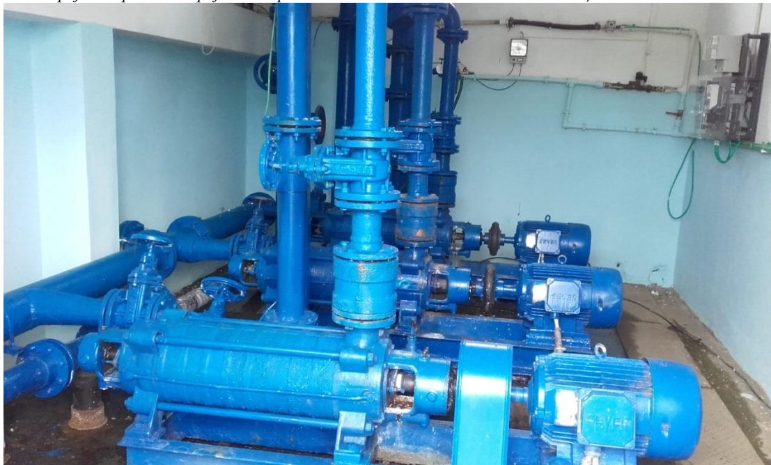
Слика број 1: Опрема постројења за пречишћавање питке воде општине Рековац